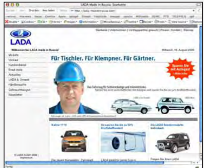
Ganz frisch in Netz: www.lada-madeinrussia.com

Mit LADA sparen Sie mehr und können die besten beruflichen Aussichten erfahren.